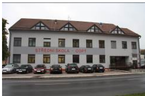
Budova vedení SŠ a VŠ