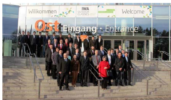
IWA OUTDOOR CLASSICS 2017