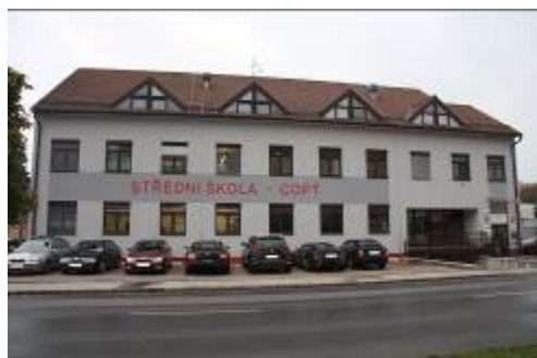
Budova vedení SŠ a VŠ